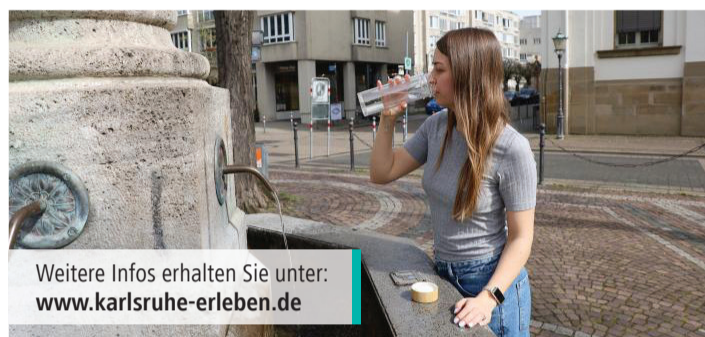
Weitere Infos erhalten Sie unter: www.karlsruhe-erleben.de

Hinweis: Im Sinne der Nachhaltigkeit werden die Teilnehmer*innen gebeten, ihr eigenes Trinkgefäß mitzubringen, ansonsten werden aber auch Trinkbecher zur Verfügung gestellt.