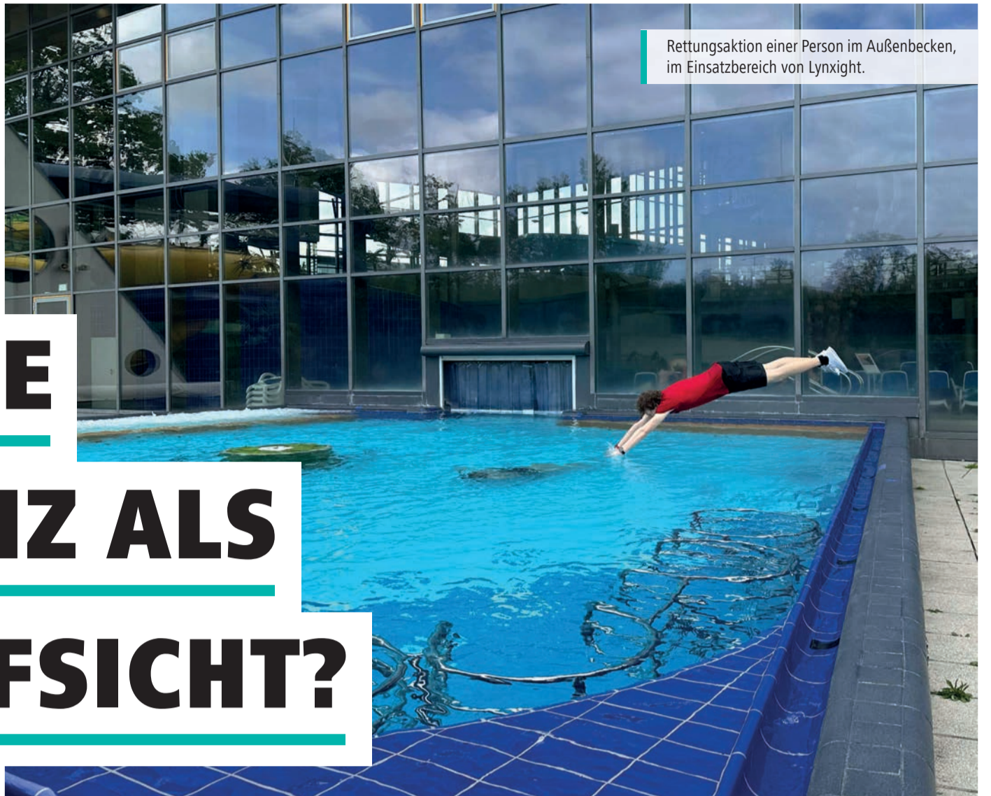
Rettungsaktion einer Person im Außenbecken, im Einsatzbereich von Lynxight.