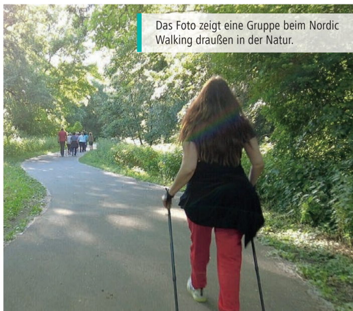
Das Foto zeigt eine Gruppe beim Nordic Walking draußen in der Natur.