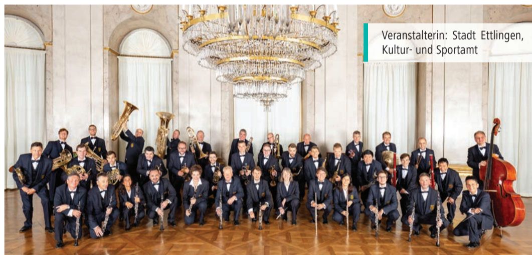
Veranstalterin: Stadt Ettlingen, Kultur- und Sportamt

Karten gibt es im Vorverkauf und an der Abendkasse zu 18€/22€/25€. Auch erhältlich bei der Touristinfo Ettlingen, Tel. 07243 / 101 333 und unter www.ettlingen.de/kulturlive sowie www.reservix.de Ermäßigte bezahlen 50 %.