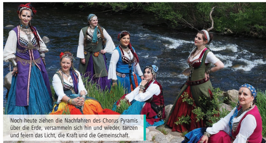
Noch heute ziehen die Nachfahren des Chorus Pyramis über die Erde, versammeln sich hin und wieder, tanzen und feiern das Licht, die Kraft und die Gemeinschaft.

Anreise per Regionalbahn / Haltestelle Gernsbach Mitte / Fußweg stadtauswärts entlang der Murg zur Murginsel Parkplätze auf dem Färbtorplatz begrenzt verfügbar