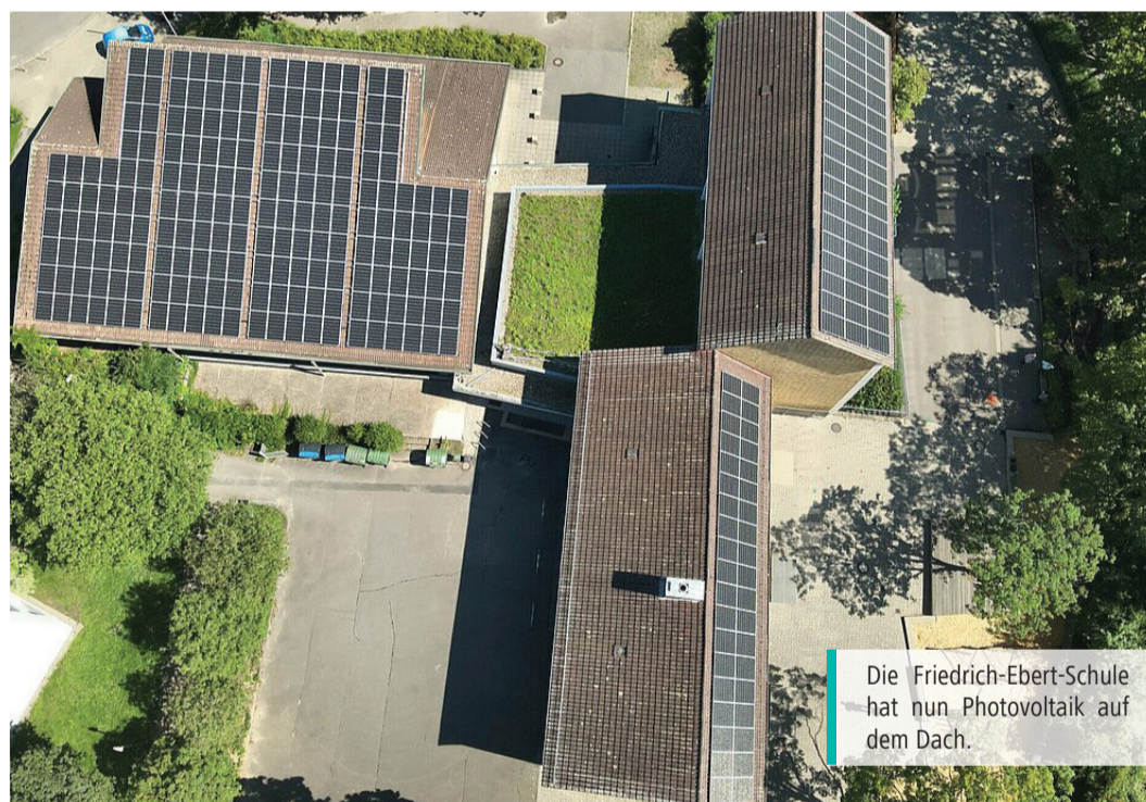
Die Friedrich-Ebert-Schule hat nun Photovoltaik auf dem Dach.