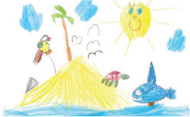
Zeichnung: Teilnehmendes Kind vom vergangenen Malwettbewerb

Weitere Informationen unter: ka-europabad.de