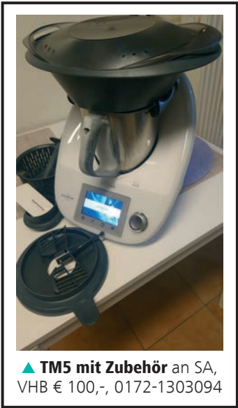
▲ TMS mit Zubehör an SA, VHB € 100,-, 0172-1303094

▲ Liebherr Gefrierschrank , 148x60x60 cm, 7 Schubladen, € 50,-, 07248-1040