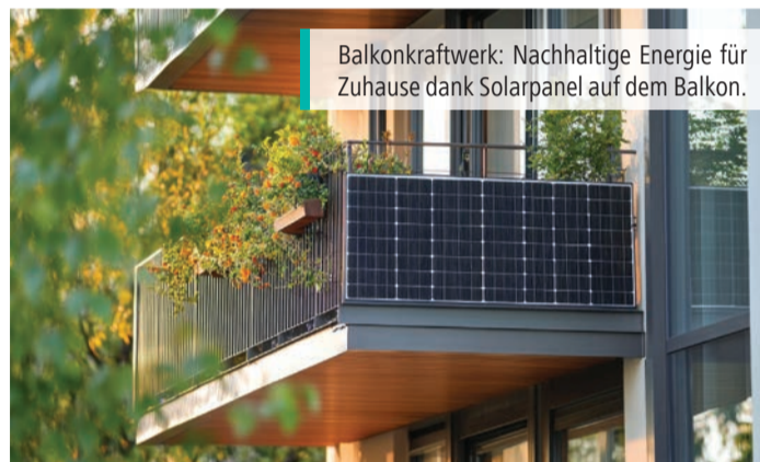
Balkonkraftwerk: Nachhaltige Energie für Zuhause dank Solarpanel auf dem Balkon.

Die Nachfrage nach Solaranlagen steigt derzeit deutlich. Mehrere Anbieter berichten gegenüber dem unabhängigen Geldratgeber Finanztip von rund 50 Prozent mehr Anfragen in den vergangenen Wochen. Hintergrund ist unter anderem das drohende Ende der Einspeisevergütung für neue Anlagen. Balkonkraftwerke können den Strombedarf eines Haushalts spürbar senken – sorgen aber nur begrenzt für Autarkie. Das zeigt eine aktuelle Auswertung von Finanztip.