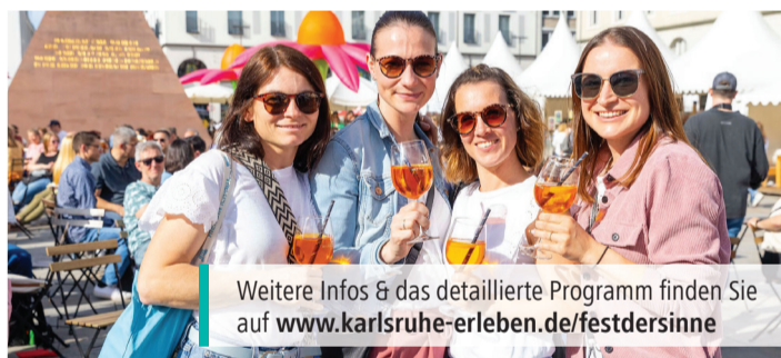
Weitere Infos & das detaillierte Programm finden Sie auf www.karlsruhe-erleben.de/festdersinne

Vorabinformation! Änderungen vorbehalten!