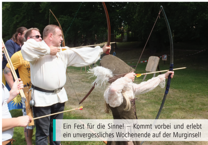
Ein Fest für die Sinne! – Kommt vorbei und erlebt ein unvergessliches Wochenende auf der Murginsel!