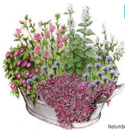
Illustration: NABU / NelumboArt Stefanie Gendera

Geeignete Pflanzen für den schattigen Balkon sind beispielsweise Efeu, Vergissmeinnicht, Beinwell und Blutampfer. Wer einen eher son-